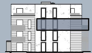
Ansicht West (ohne Maßstab)