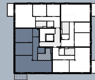
Grundriss (ohne Maßstab)