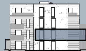
Ansicht West (ohne Maßstab)