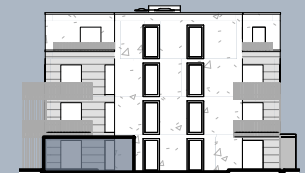
Ansicht Ost (ohne Maßstab)