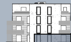
Ansicht Ost (ohne Maßstab)