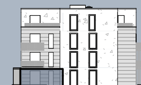
Ansicht West (ohne Maßstab)