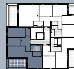
Grundriss (ohne Maßstab)