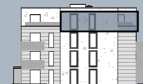
Ansicht West (ohne Maßstab)