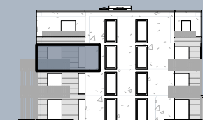
Ansicht Ost (ohne Maßstab)