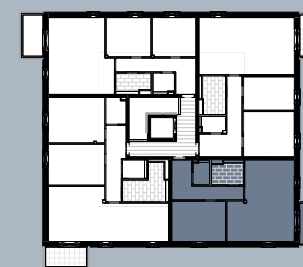
Grundriss (ohne Maßstab)