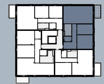
Grundriss (ohne Maßstab)