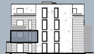
Ansicht West (ohne Maßstab)