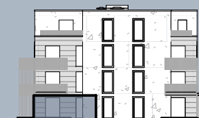
Ansicht Ost (ohne Maßstab)