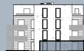
Ansicht Ost (ohne Maßstab)