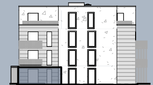
Ansicht West (ohne Maßstab)