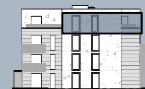
Ansicht West (ohne Maßstab)