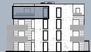
Ansicht Ost (ohne Maßstab)