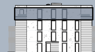
Ansicht Nord (ohne Maßstab)