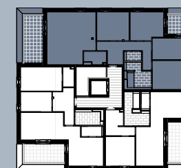
Grundriss (ohne Maßstab)