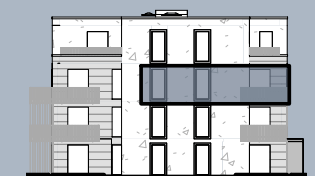
Ansicht Ost (ohne Maßstab)