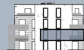
Ansicht Ost (ohne Maßstab)