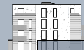
Ansicht West (ohne Maßstab)