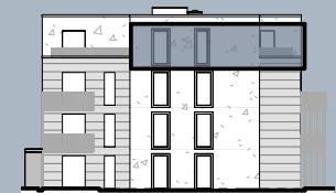
Ansicht West (ohne Maßstab)