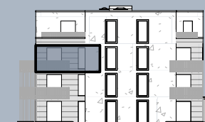
Ansicht Ost (ohne Maßstab)