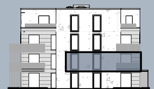
Ansicht Ost (ohne Maßstab)