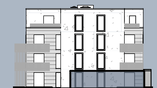
Ansicht Ost (ohne Maßstab)