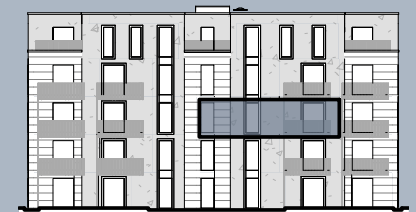
Ansicht West ( ohne Maßstab)