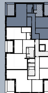
Grundriss (ohne Maßstab)