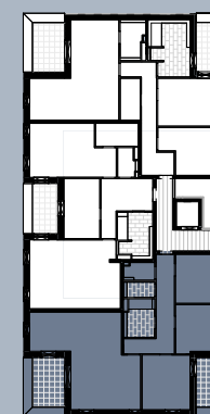
Grundriss (ohne Maßstab)