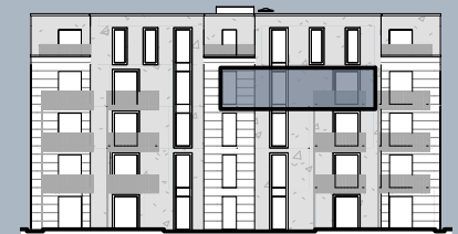
Ansicht West ( ohne Maßstab)