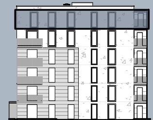
Ansicht West (ohne Maßstab)