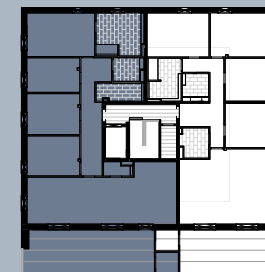
Grundriss (ohne Maßstab)