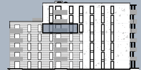
Ansicht West (ohne Maßstab)