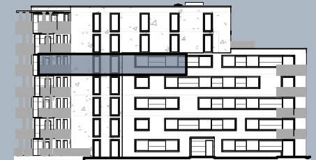
Ansicht Ost (ohne Maßstab)