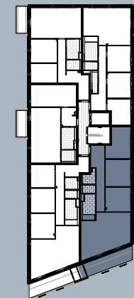
Grundriss (ohne Maßstab)