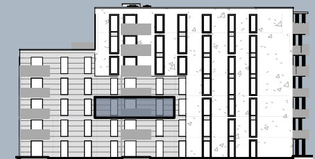
Ansicht West (ohne Maßstab)