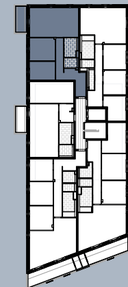
Grundriss (ohne Maßstab)