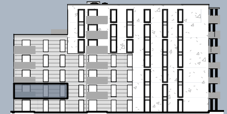
Ansicht West (ohne Maßstab)