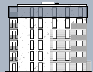
Ansicht Ost (ohne Maßstab)