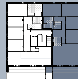
Grundriss (ohne Maßstab)