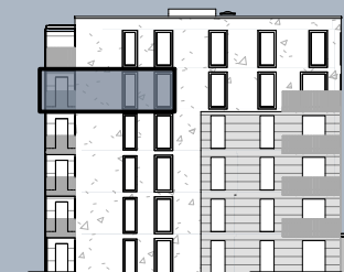
Ansicht Ost (ohne Maßstab)