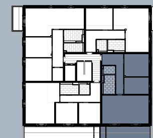
Grundriss (ohne Maßstab)