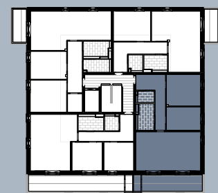
Grundriss (ohne Maßstab)