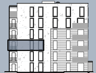
Ansicht Ost (ohne Maßstab)