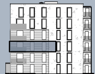
Ansicht West (ohne Maßstab)