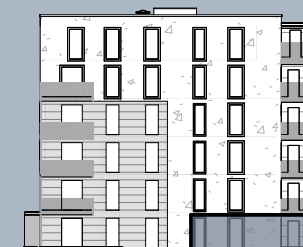
Ansicht West (ohne Maßstab)