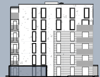
Ansicht Ost (ohne Maßstab)